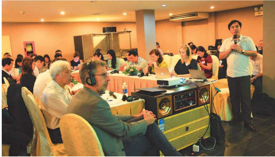
Quang cảnh buổi thảo luận mở tại TP. Quy Nhơn, tỉnh Bình Định về cách thức thực hiện các mục tiêu quốc gia về giảm RTN biển, ngày 30/11/2023

ngư dân và nông dân sẵn lòng tham gia các sáng kiến quản lý chất thải tập thể, nếu được đảm bảo sự tham gia rộng rãi. Du khách cũng ủng hộ các giải pháp sáng tạo như đài phun nước uống để giảm sử dụng nhựa. Việc triển khai các ưu đãi cho việc thu gom và tái chế chất thải có thể mang lại nguồn thu nhập bổ sung cho cộng đồng ven biển, đồng thời giải quyết các thách thức về ô nhiễm.