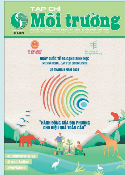
Chủ đề Ngày Quốc tế đa dạng sinh học 22/5/2026: "Acting locally for global impact" - "Hành động của địa phương cho hiệu quả toàn cầu"