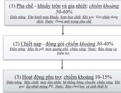
Hình 3.2. Phân bố tiêu thụ năng lượng theo công đoạn sản xuất tại doanh nghiệp nghiên cứu

Các tỷ lệ thất thoát này được ước tính trên cơ sở khảo sát hiện trường, phân tích chế độ vận hành thiết bị, đối chiếu với